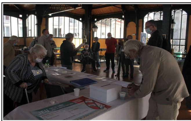
Urne pour tombola FFAP Adphile

Le dimanche, les visiteurs ont aussi pu parcourir les 35 stands des exposants professionnels et particuliers venant de l'Yonne et des départements voisins. Tous les collectionneurs pouvaient y trouver leur bonheur en chinant parmi les objets de collection proposés (timbres, cartes postales anciennes, fèves, livres, disques, voitures miniatures, muselets de champagne, ...).