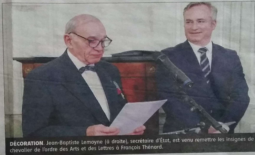
DÉCORATION. Jean-Baptiste Lemoigne (à droite), secrétaire d'État, est venu remettre les insignes de chevalier de l'ordre des Arts et des Lettres à François Thénard.

Initié à la philatélie par son père dès l'âge de 8 ans, il commence par la même occasion à croiser ces deux passions. Il publiera 6 livres, 370 articles et 260 éditoriaux philatéliques jusqu'à aujourd'hui. Au fil des rencontres et