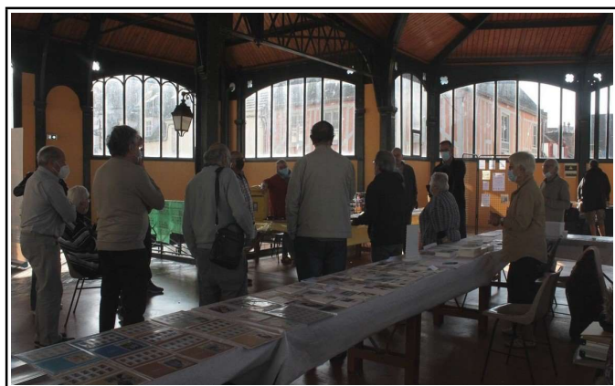
Stand de la Poste et du CPS

La synergie entre ces deux événements a permis d'obtenir un important succès populaire. En effet, au cours de ce week-end plus de 500 visiteurs ont parcouru l'exposition sur la mezzanine du marché couvert de Sens. Elle présentait les collections de 8 adhérents du CPS et d'un adhérent de l'Amicale philatélique auxerroise. Entre les stands de La Poste, de l'amicale philatélique auxerroise, de l'Atelier du Timbre destiné à la jeunesse (lire par ailleurs) et du Club philatélique sénonais, les visiteurs ont pu apprécier des voitures miniatures, des documents philatéliques et des cartes postales anciennes représentant la ville de Sens du début du XX ème siècle.