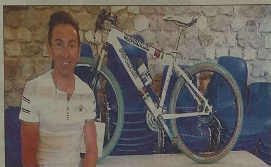
CHAMPION. Parmi les sportifs invités se trouvait Miguel Martinez, champion olympique de VTT et double champion du monde en cyclocross.