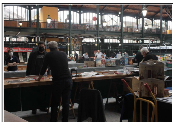
A bientôt pour la 3ème bourse le 25/9/22.