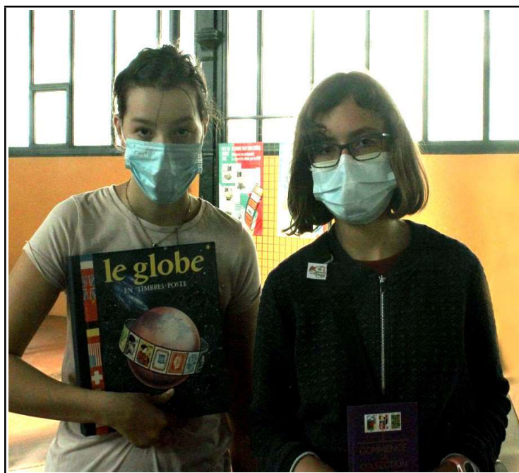
Attribution du prix lors de la remise du quizz rempli.

Présentation d'un tableau établi à partir de timbres fournis par un membre du club pour initier cette activité auprès des jeunes. La durée de leur présence n'a pas permis d'utiliser cette animation qui sera reprise dans le cadre des animations scolaires à engager avec la Directrice de l'école de Gron.