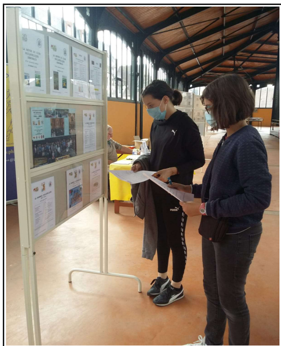
La jeune membre du club guidant une jeune dans la recherche des réponses au quizz.

Lors de la remise du questionnaire avec les réponses, les jeunes pouvaient choisir un cadeau parmi ceux fournis par l'Adphile, les loupes, les timbres, les cartes postales et les trousse de feutre ont eu le plus de succès.