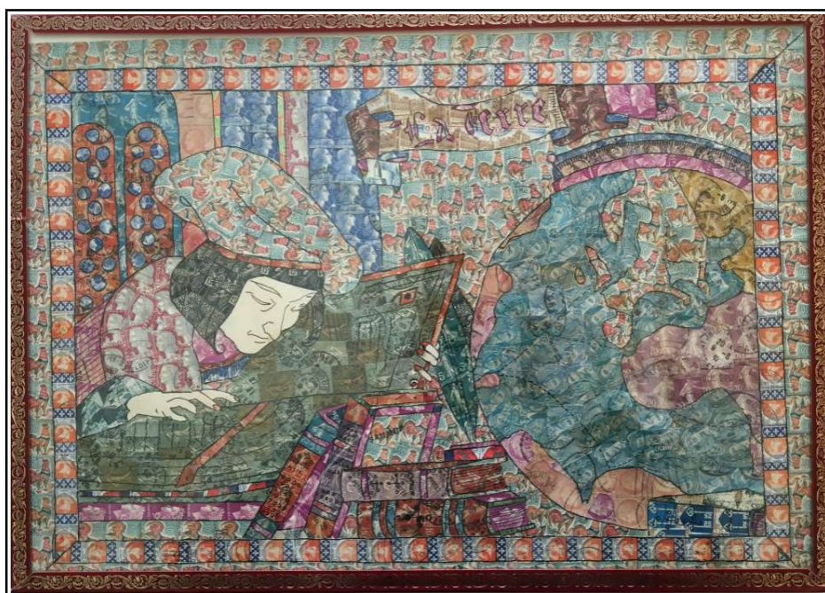
Christophe Colomb consultant ses livres devant une mappe monde.

Présentation d'un tableau établi à partir de timbres fournis par un membre du club pour initier cette activité auprès des jeunes. La durée de leur présence n'a pas permis d'utiliser cette animation qui sera reprise dans le cadre des animations scolaires à engager avec la Directrice de l'école de Gron.