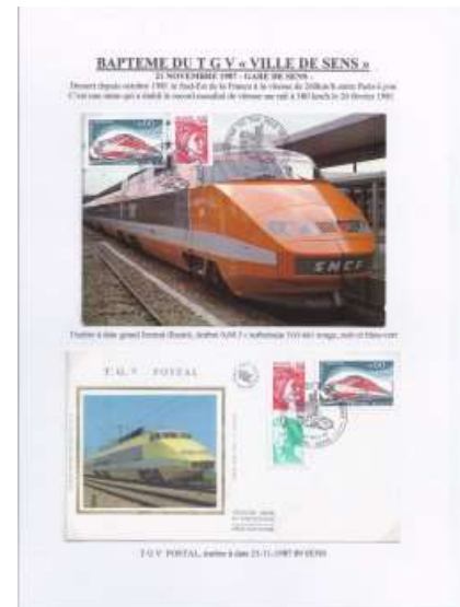
TGV "Ville de Sens"